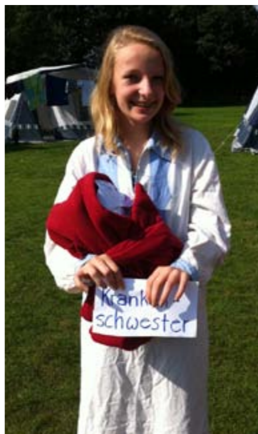
Bibelentertainment beim Konfi-Zelten