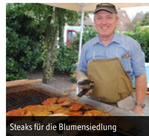
Steaks für die Blumensiedlung