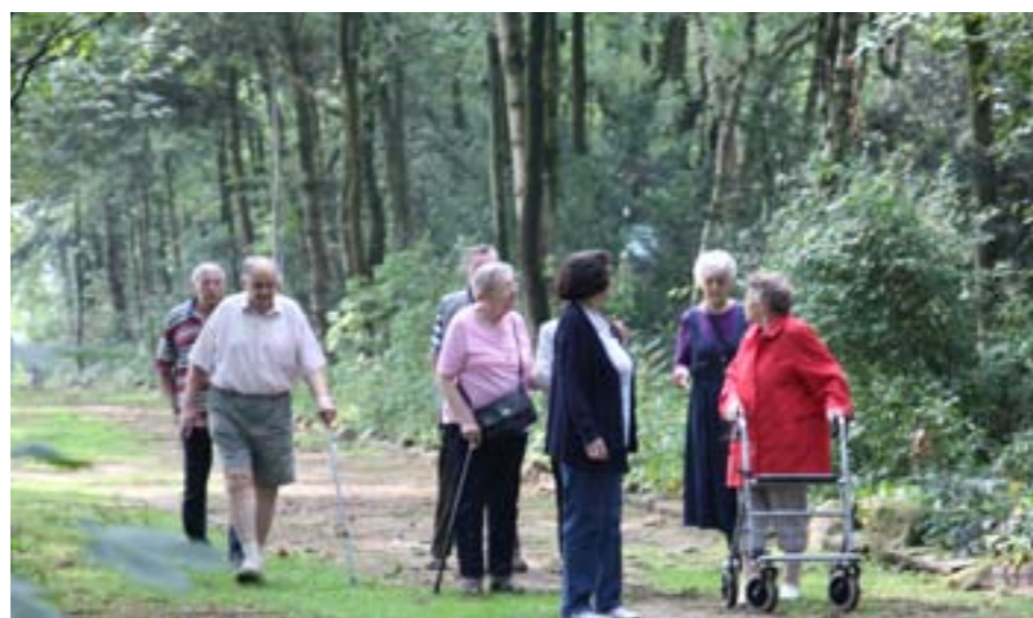
Spaziergang auf der Seniorenfreizeit in Bad Laer