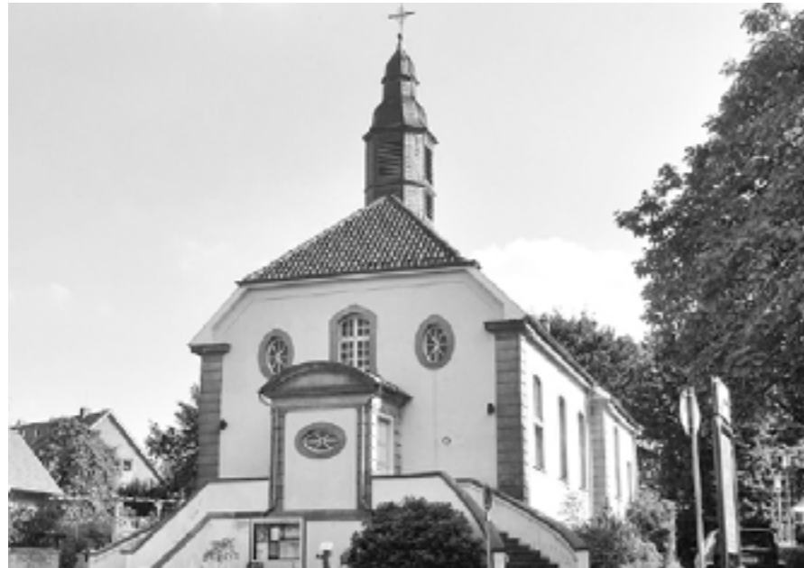
Die erste Kirche der Grafschaft in Bad Bentheim

Im Jahre 1544 wurde die Grafschaft Bentheim unter Graf Arnold I. lutherisch. Sein Enkel, Graf Arnold II., führte 1588 dann das reformierte Bekenntnis ein. Allerdings dauerte es einige Jahre, bis sich dieses in allen Grafschafter Gemeinden durchgesetzt hatte. Die Klöster Wietmarschen und Frenswegen sowie die Bauernschaften Drievorden und Engden blieben auch nach der Reformation katholisch.