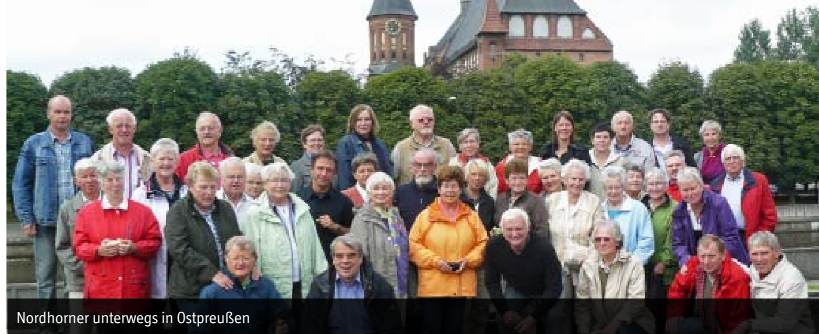
Nordhorner unterwegs in Ostpreußen

Diakonieverband Grafschaft Bentheim e.V. Ootmarsumer Weg 77, 48527 Nordhorn Telefon 05921 703-0, Fax 05921 703-264