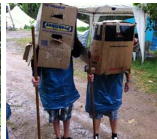
Putzkolonne auf Korsika