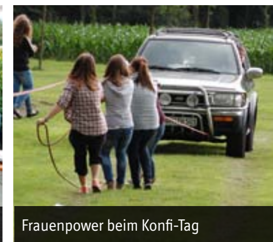
Frauenpower beim Konfi-Tag