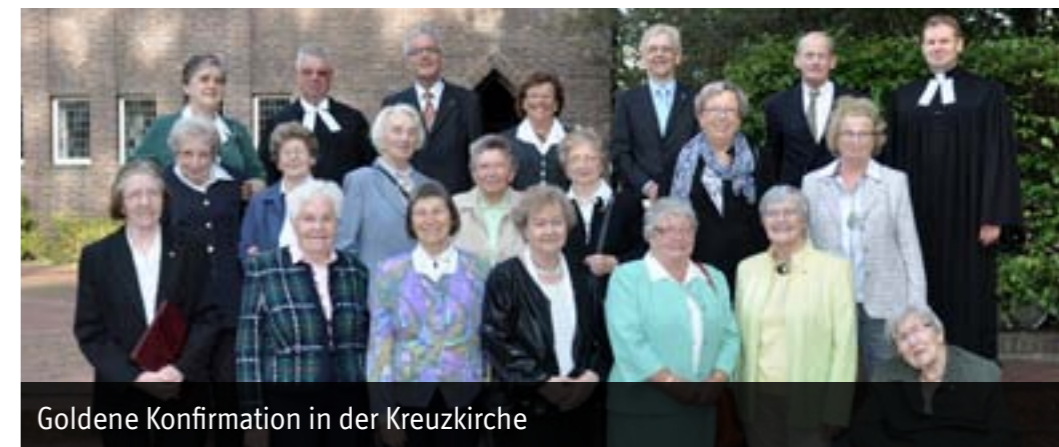
Goldene Konfirmation in der Kreuzkirche